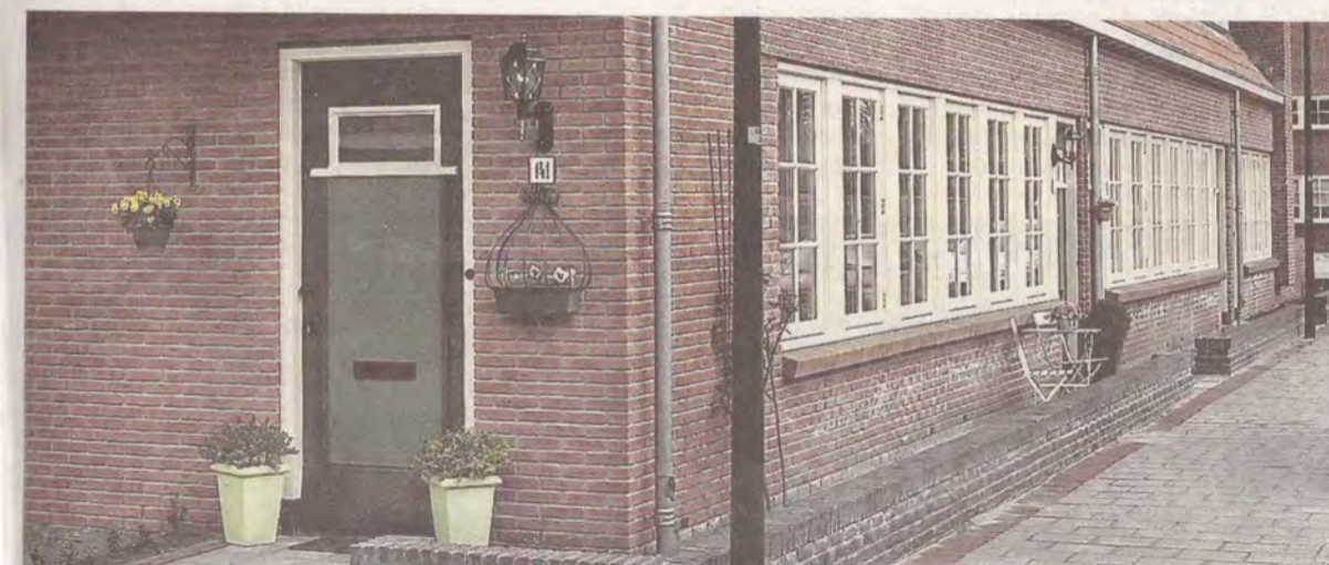
Dudokwoningen aan het Van 't Hoffplein in Hilversum.