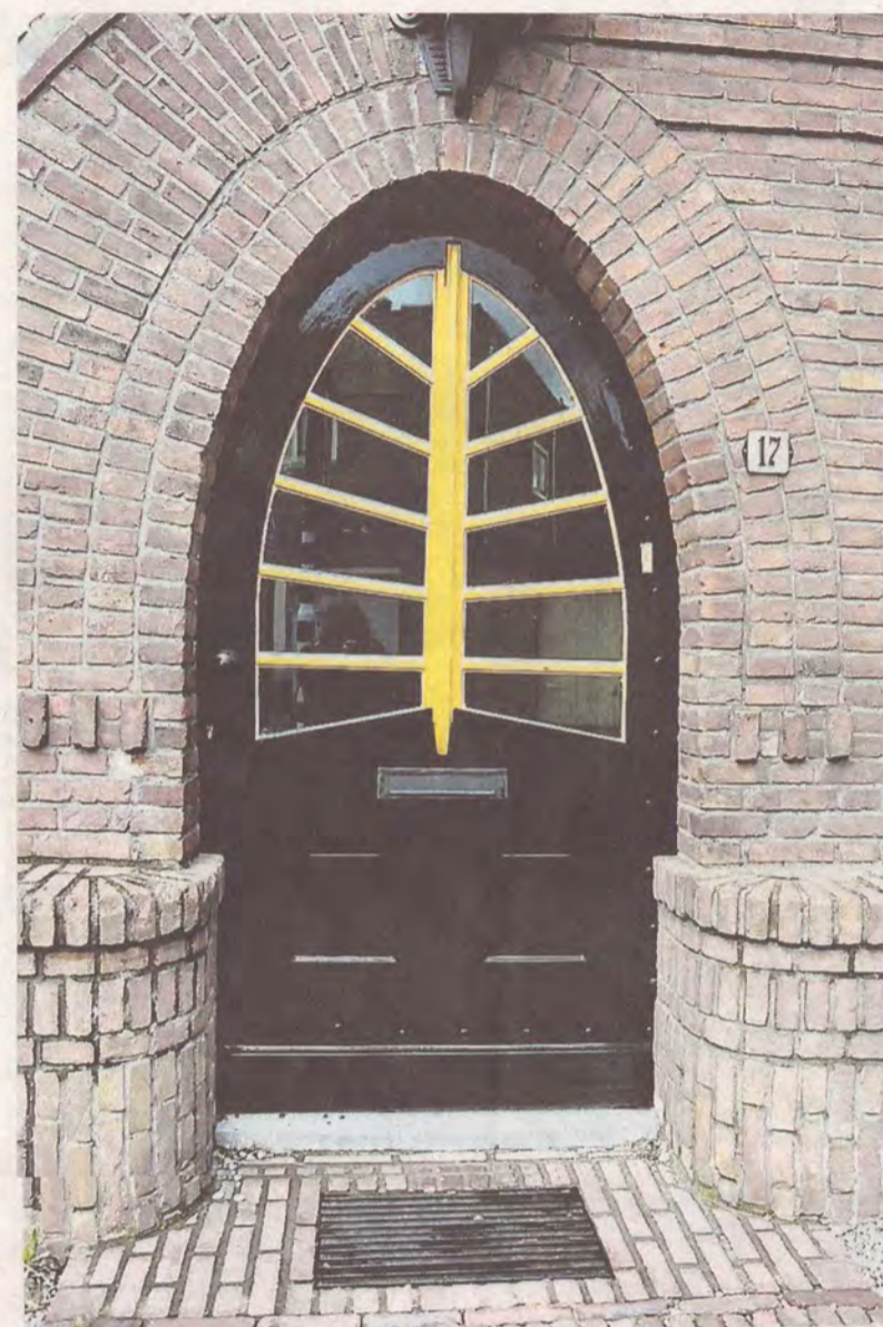
Dudok had oog voor detail.