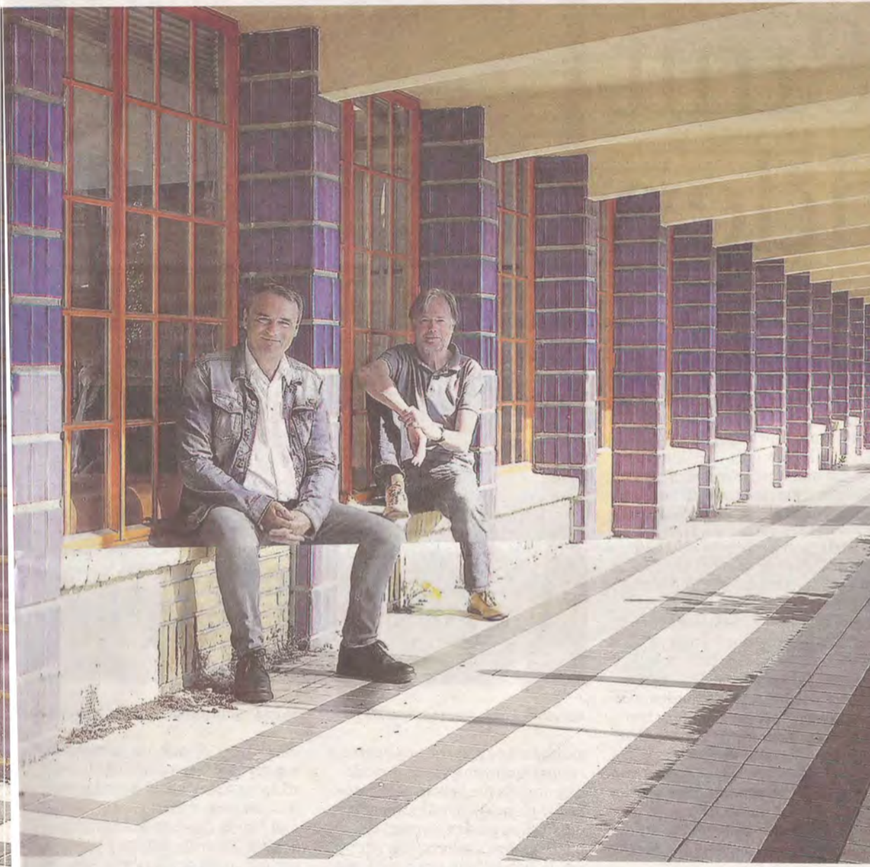
documentaire een ode aan architect Dudok.