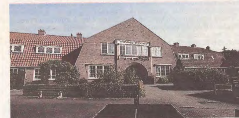
De oude openbare leeszaal aan de Newweg.