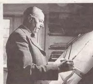
Dudok BEGRAAFPLAATS